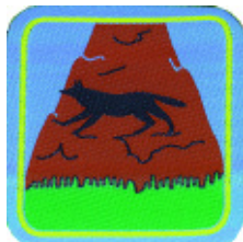
2° momento: Lupo delle rupe