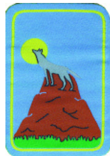
3° momento: Lupo anziano