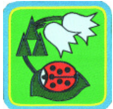
Coccinella del bosco