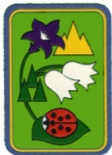
Coccinella della montagna